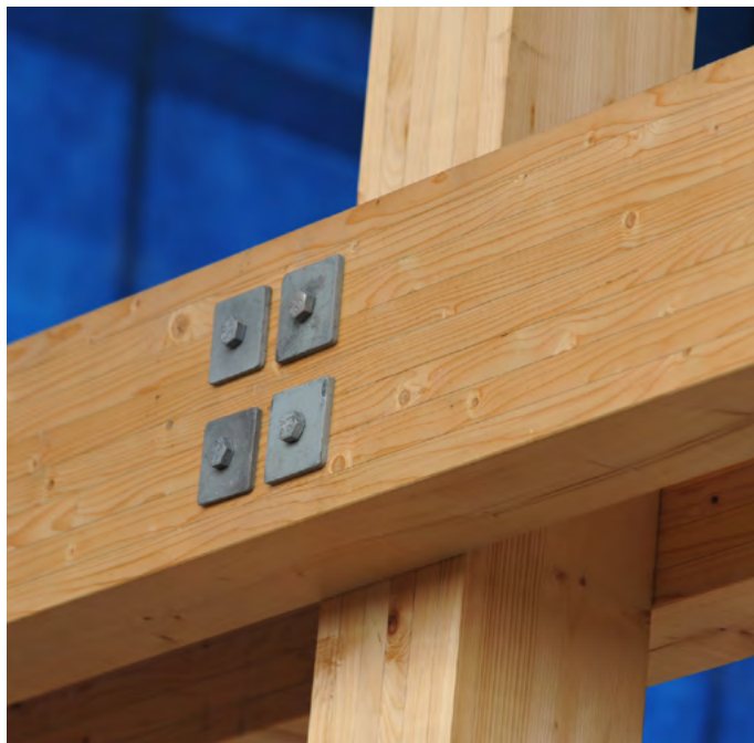
Detalje Danmarks Sukkermuseum