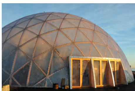
Dome of Visions 3.0