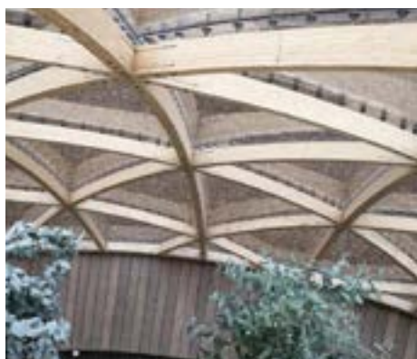
Dome of Visions