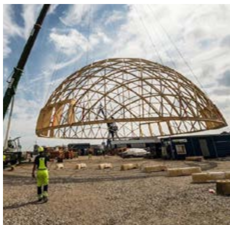
Dome of Visions