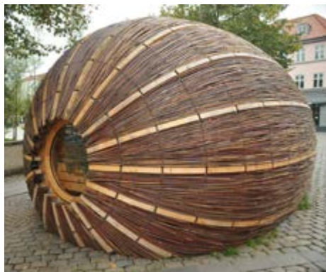
Den grønne ambassade