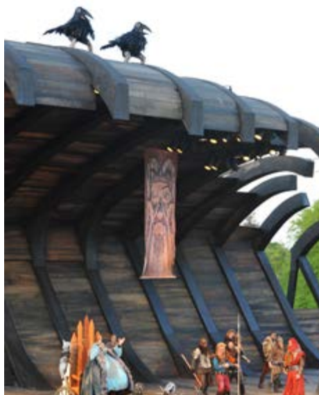
Scene, "Røde Orm", Kgl. Teater