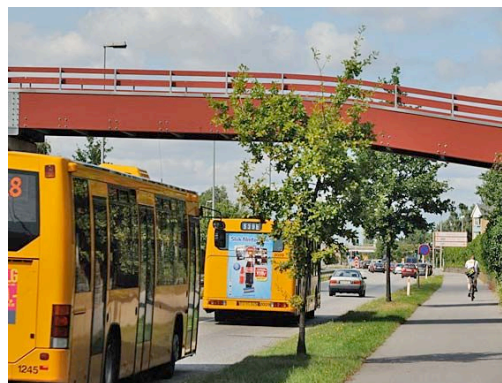
Fodgængerbro over Avedøre Havnevej